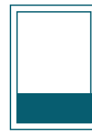
1/4 Seite quer 200 x 68 mm