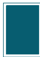
1/1-Seite 200 x 287 mm