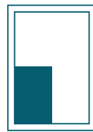
1/4-Seite hoch 98 x 141 mm