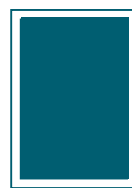
1/1-Seite 200 x 287 mm